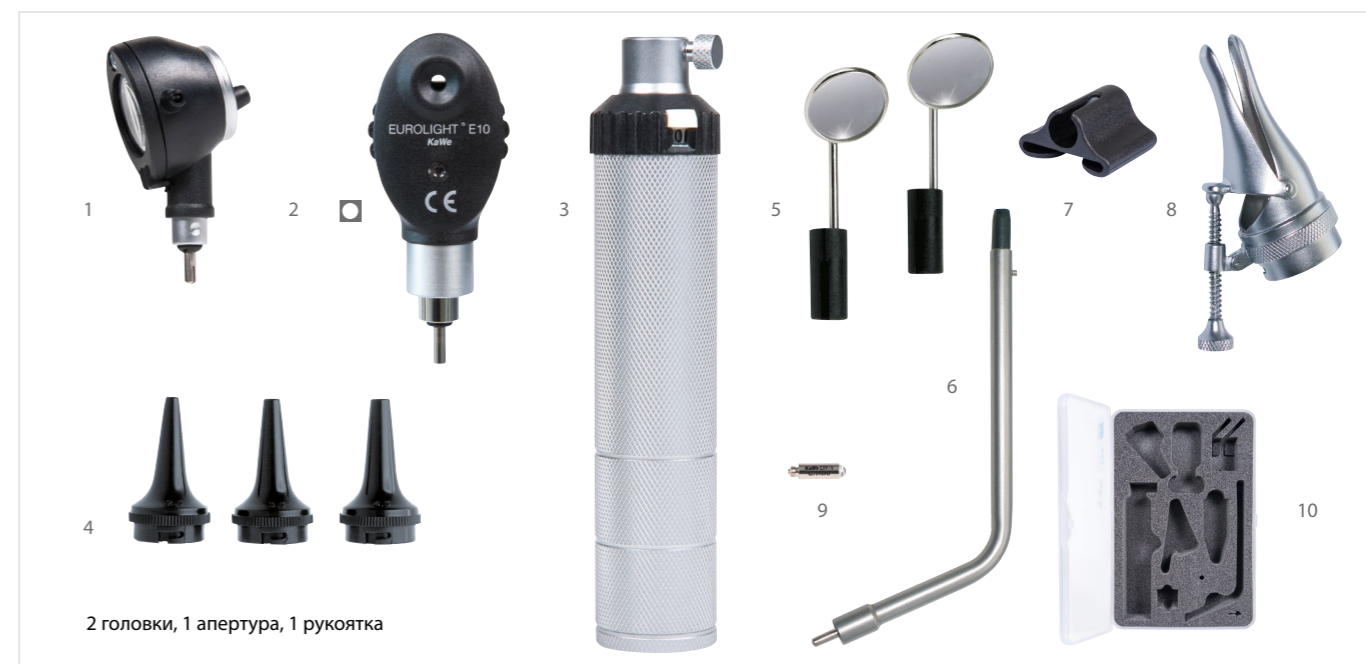
2 головки, 1 апертура, 1 рукоятка