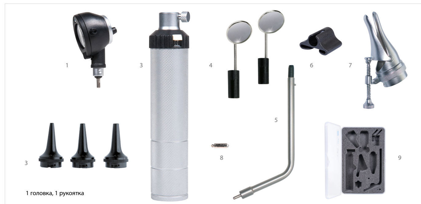
1 головка, 1 рукоятка