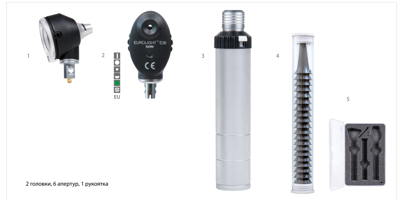
2 головки, 6 апертур, 1 рукоятка