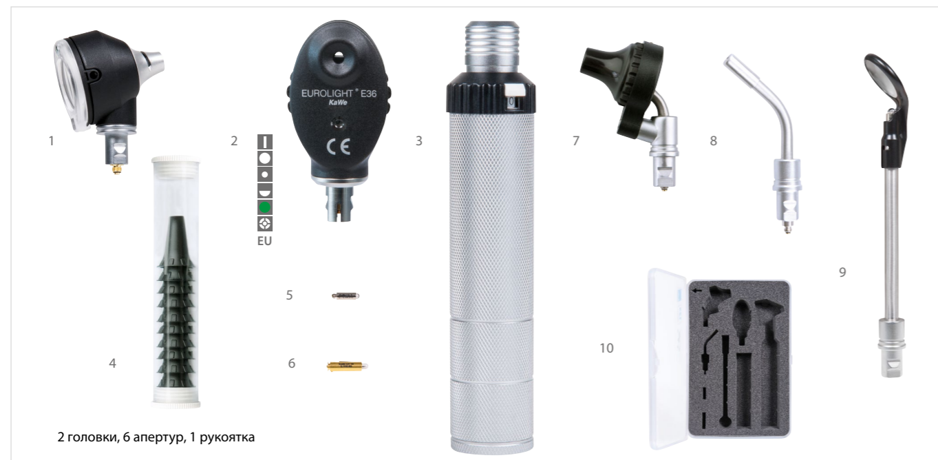
2 головки, 6 апертур, 1 рукоятка