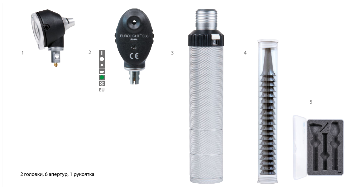
2 головки, 6 апертур, 1 рукоятка