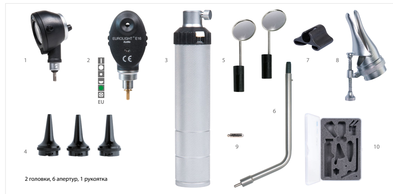
2 головки, 6 апертур, 1 рукоятка