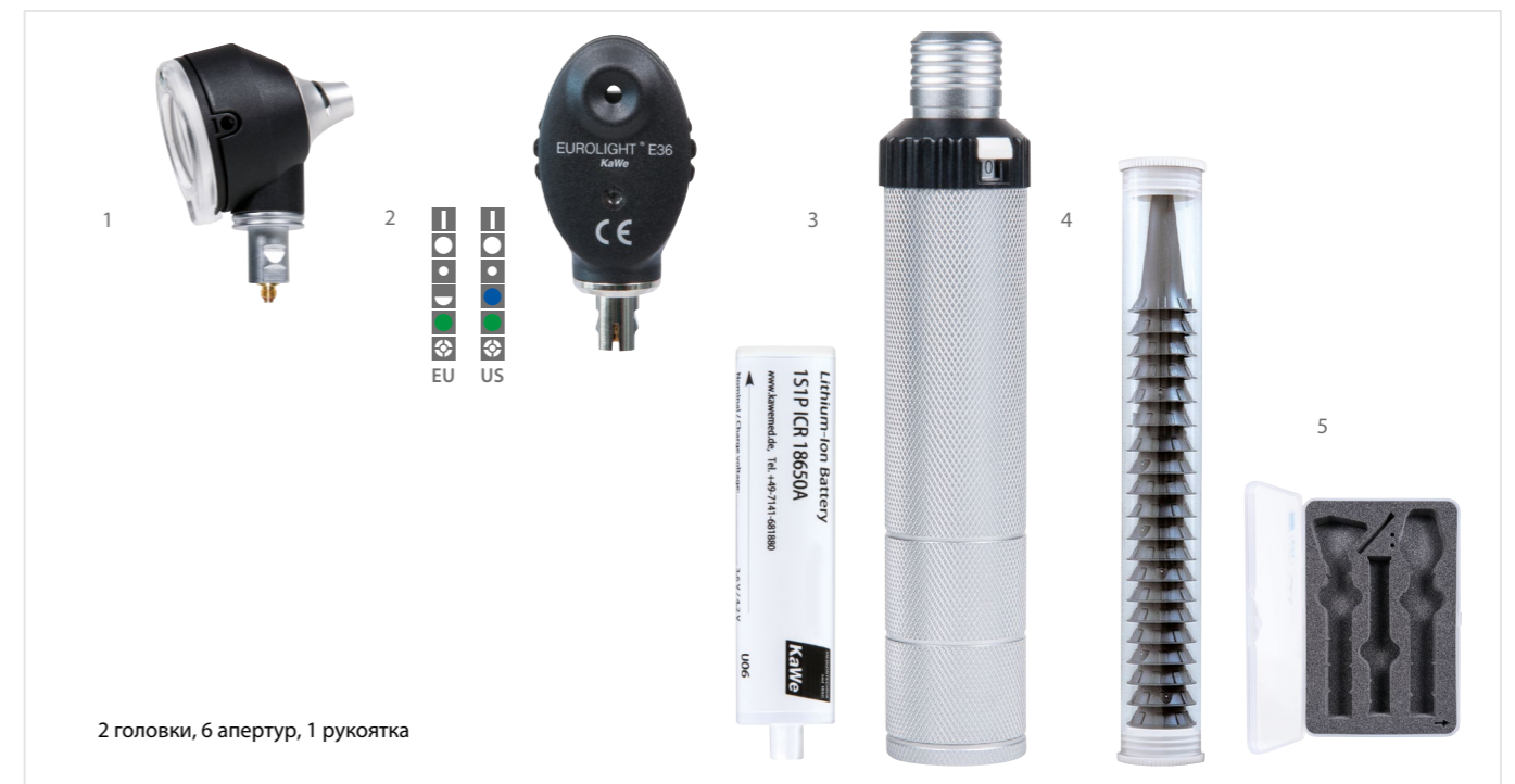
2 головки, 6 апертур, 1 рукоятка