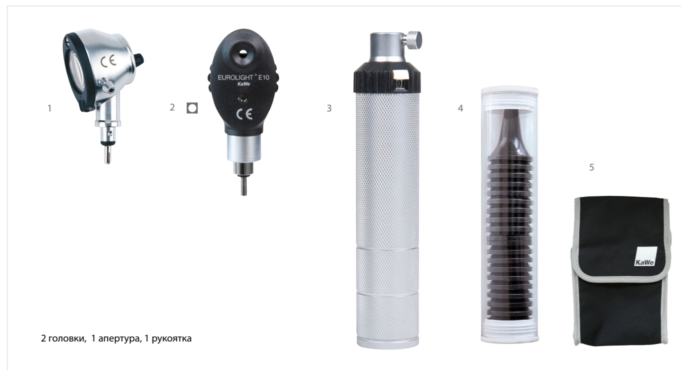
2 головки, 1 апертура, 1 рукоятка