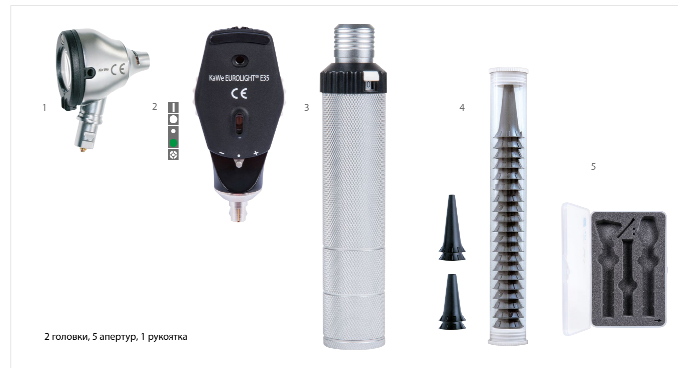
2 головки, 5 апертур, 1 рукоятка