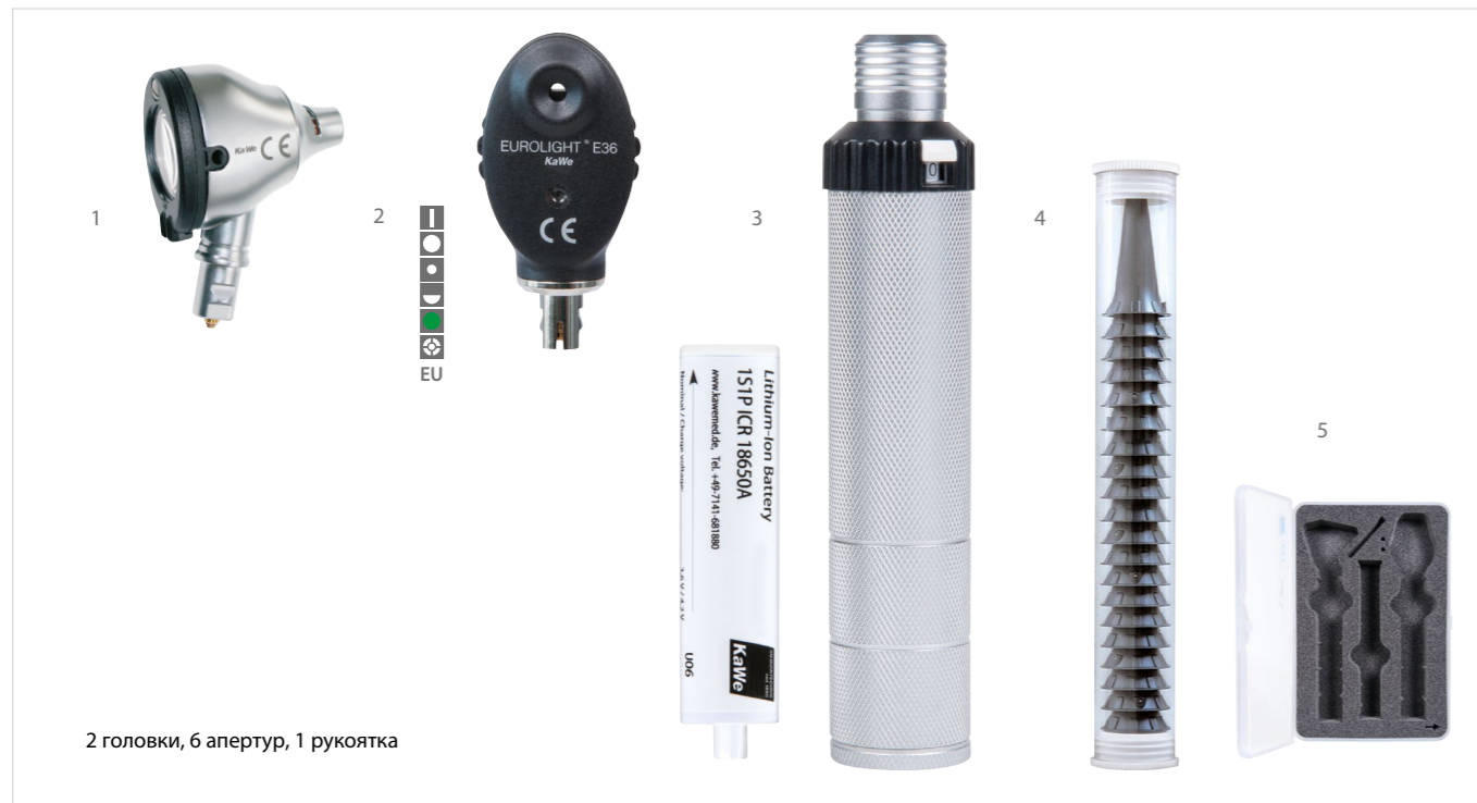
2 головки, 6 апертур, 1 рукоятка