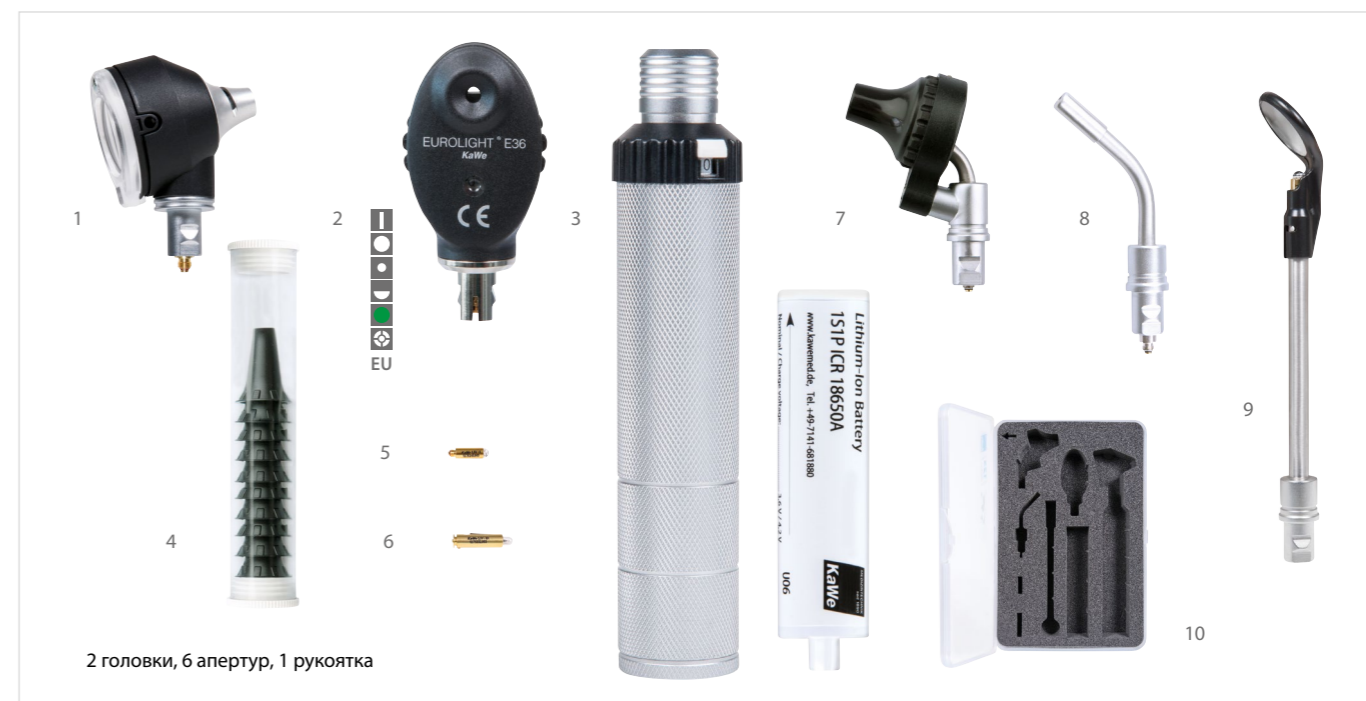
2 головки, 6 апертур, 1 рукоятка