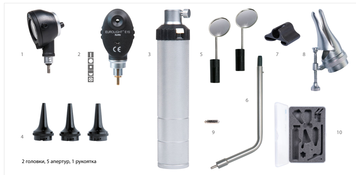
2 головки, 5 апертур, 1 рукоятка